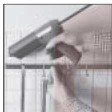
Например, фиксация кухонной планки