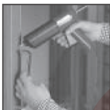
Например, крепление дверных ручек