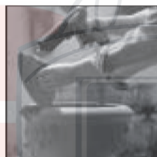
Например, ремонт цветочного горшка