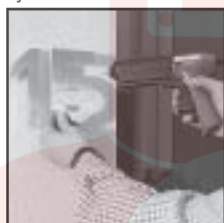
Например, крепление номеров домов