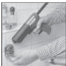
Например, крепление бачка с мылом