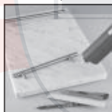
Например, изготовление подноса из мрамора